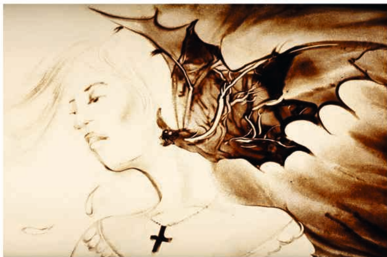
Sandmalerei (Svetlana Telbukh)