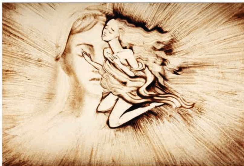
Sandmalerei (Svetlana Telbukh) 11

Wir laden Sie ein, sich auf dieses gemeinsame Erleben einzulassen: auf Dvořáks Musik, die aus der Tiefe Böhmens schöpft, und auf die Sandbilder von Svetlana Telbukh, die im Augenblick entstehen und gleich darauf wieder verschwinden.