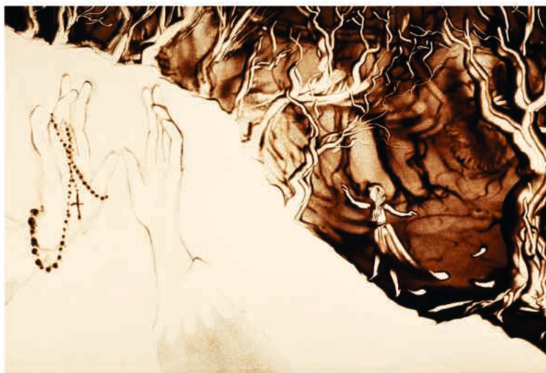
Sandmalerei (Svetlana Telbukh)